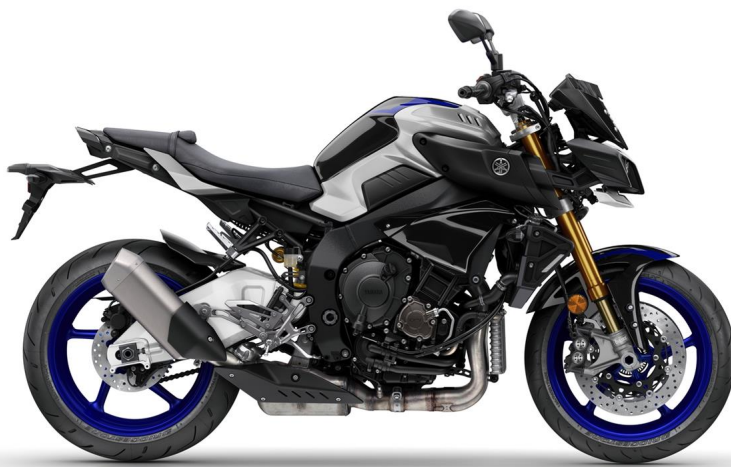
Silver Blu Carbon