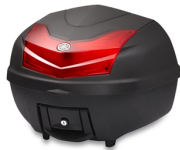
39 literes városi hátsó doboz