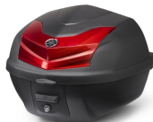
30 literes városi hátsó doboz