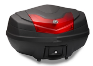
50 literes hátsó doboz, City

Az összes TMAX tartozék megtekintéséhez látogassa meg a honlapot vagy, kérdezze márkakereskedőjét.