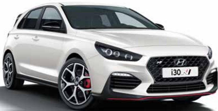
i30 N (250 LE)