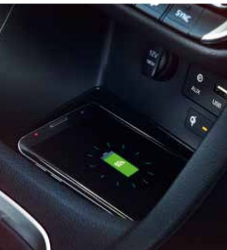
Vezeték nélküli telefontöltés

Az Apple CarPlay™ az Apple Inc. bejegyzett védjegye. Az Android Auto™ a Google Inc. bejegyzett védjegye.