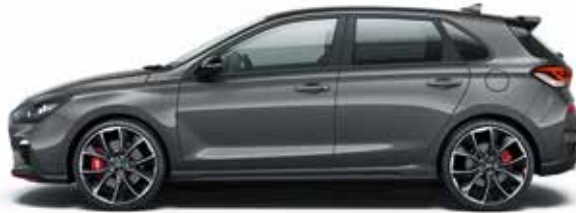
Micron grey (metál)