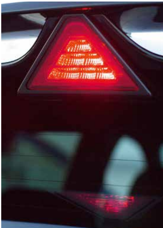
A fényes fekete hátsó spoilerben beépített háromszög féklámpa található a stílusosság, a jobb aerodinamika és a jobb láthatóság érdekében.

A Hyundai tervezői szorosan együttműködtek az aerodinamikai szakemberekkel a lehető legjobb vezetési élmény elérése érdekében. A kétszintes hátsó spoiler beépített háromszög alakú féklámpával növeli a lenyomó erőt, hogy nagyobb tapadást biztosítson a gyors kanyarokban - minimálisra csökkentve a billenést és maximálisan növelve az élményt. A feltűnő hátsó LED-lámpák összhangban vannak az agresszív első kialakítással, kiemelve az egyedi hátsó megjelenést.