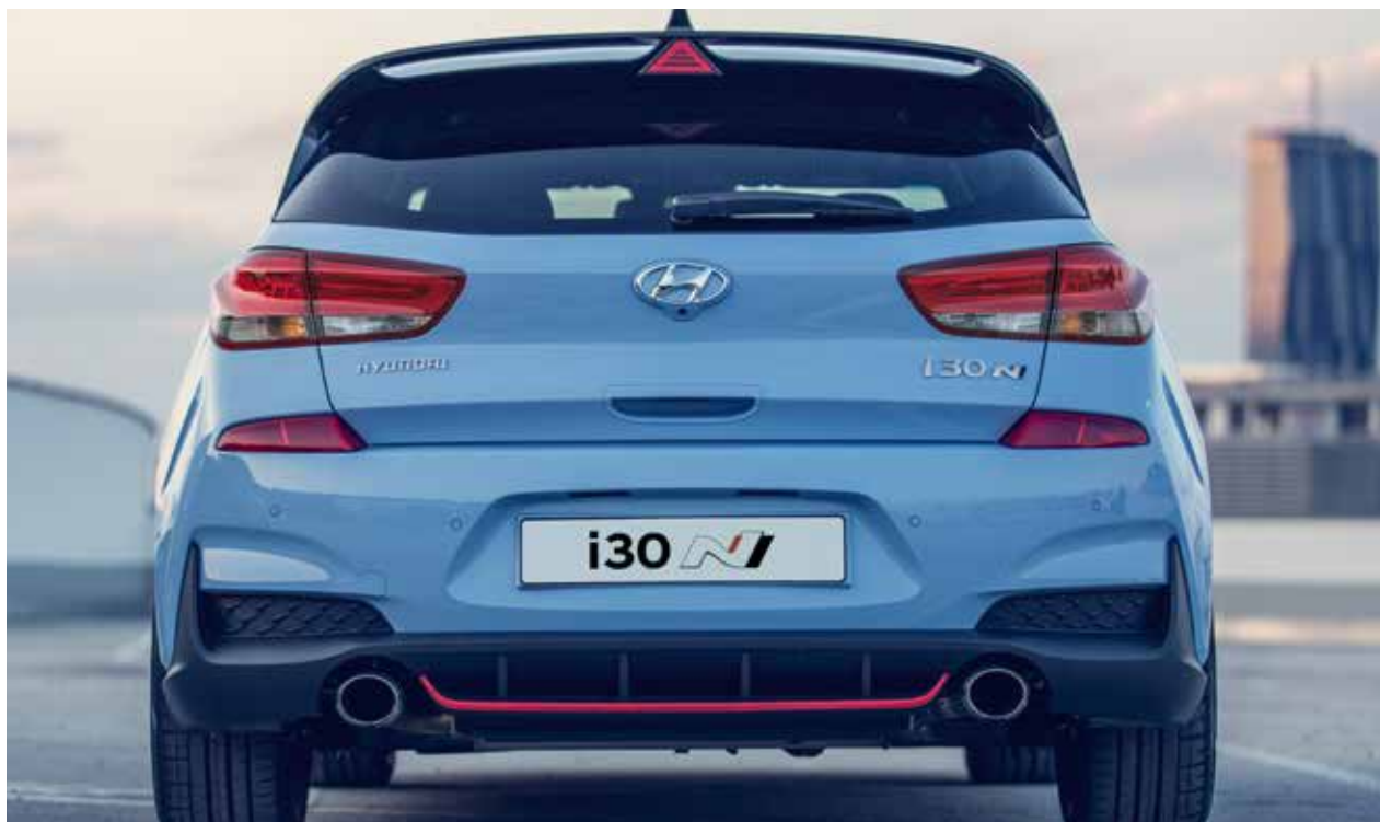
Az agresszíven kialakított hátsó lökhárító a krómozott dupla kipufogóval sportos és erőteljes megjelenést mutat, amelyet kiemel a kipufogók közötti piros vonal.