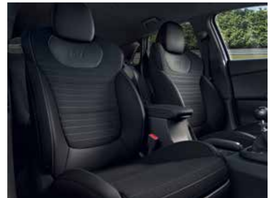
Szövetkárpit (alapfelszereltség mind az i30 N, mind az i30 N Performance csomagban) Velúr-bőr kombináció (opcionális)