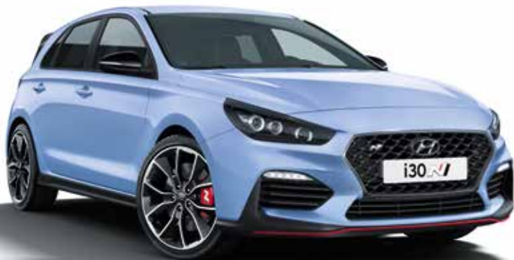
i30 N Performance csomaggal (275 LE)