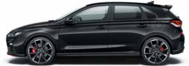
Phantom Black (gyöngyház)