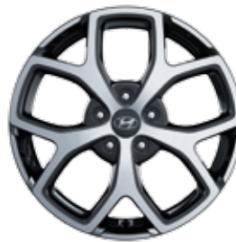
18"-os könnyűfém keréktárcsa