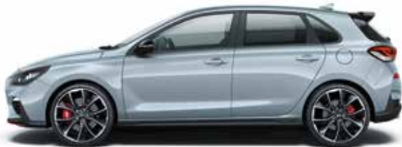
Clean Slate (metál)