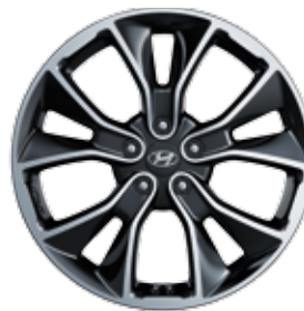
19"-os könnyűfém keréktárcsa