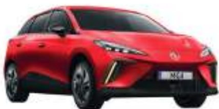
● Diamond Red