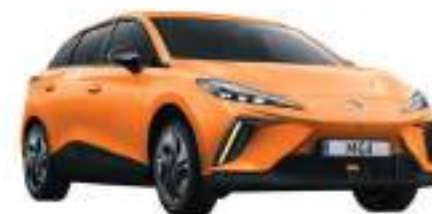
● Fizzy Orange