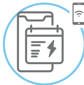
Tervezd meg a töltéseket