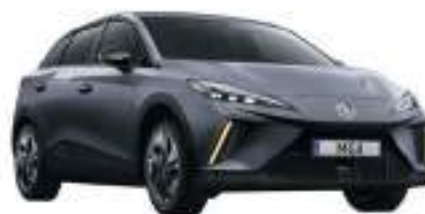
● Andes Grey