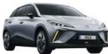
● Medal Silver