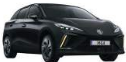
● Pebble Black

Válassz a Family vagy Comfort felszereltségi szintek között a hozzád leginkább illő színben, és elismerő tekintetek sokasága fog útjaidon végigkísérni.