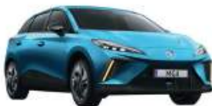
● Brighton Blue