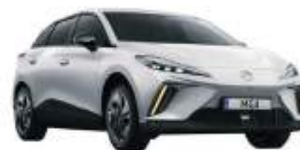
○ Dover White